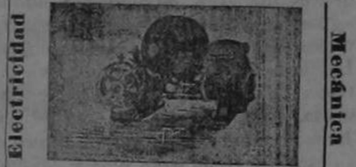
LADO ESTE—COLEGIO SEÑORITAS